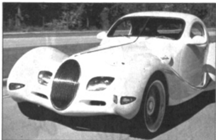
Der „Yello Talbo“ ist in Dresden dabei.

Es ist weltweit das erste Festival, das allen Marken eine Chance gibt, sich als Kult zu präsentieren, das Raritäten aus Ost und West gleichermaßen in den Fokus stellt und das Oldtimer von gestern, Prachtstücke von heute und Studien von morgen gleichermaßen in einer einzigartigen Show zeigt. Das Besondere am „1. Internationalen Kultfahrzeugtreffen“ ist aber, dass nicht nur die Wagen gezeigt werden. Man kann mit den Besitzern ins Gespräch kommen. Die seltensten Fahrzeuge der Welt, die witzigsten Umbauten und faszinierende Details präsentieren sich in drei Themenbereichen.